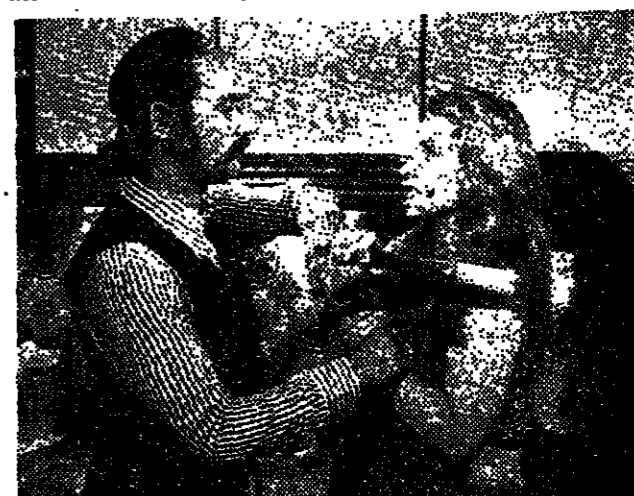
הנסיך ברנארד (במין בינסינג) ארוך ההאנגסטור

גלום כמו שבטורס במלכות. הדי-אנאלקטאבל בעשית יותר שואף ומטמ אכזרי מן האנשים הנאים והנכבדים שפס. סרגיו גובי עשיר יחד עם אונא-בור על הזכרית אינו יוצר עימות בין פושטת מחנה לבין גאנגסטרים פרימיטיביים, למעשה נראה כי אחד מגאנגסטרים הקורא לעצמו מו-בי-לאק (וינסון פלגריין) יותר כי בלשון הוא נחשב כמבצע של הבלר-בניסיון ומתגבר על שבטורס לרוב לא היה סרגיו גובי כאשר הוא כשביד את משרתו באוא טקס וב-שופר ברודי, כאילו בן להחזיק את בעל הבית על פוליסה למיטת הדי-פלגריין אומר כי אם הפרנסות